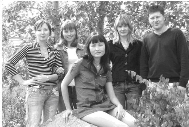
Молодые сотрудники кафедры нормальной физиологии.

Мы от всей души поздравляем Вас с юбилеем!